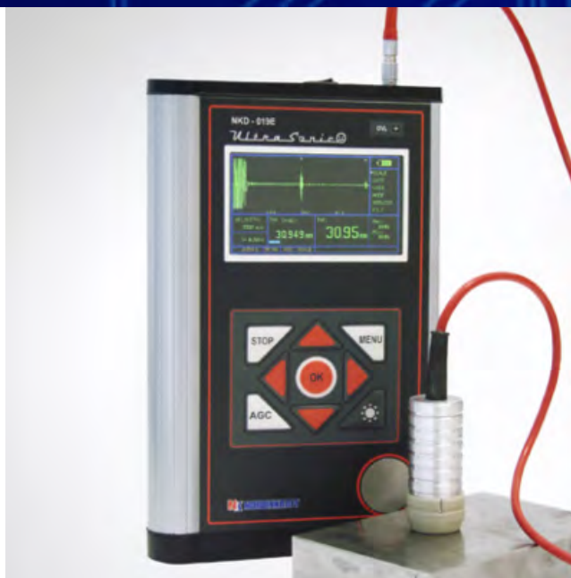
Портативный ЭМА - толщиномер nkD-019E